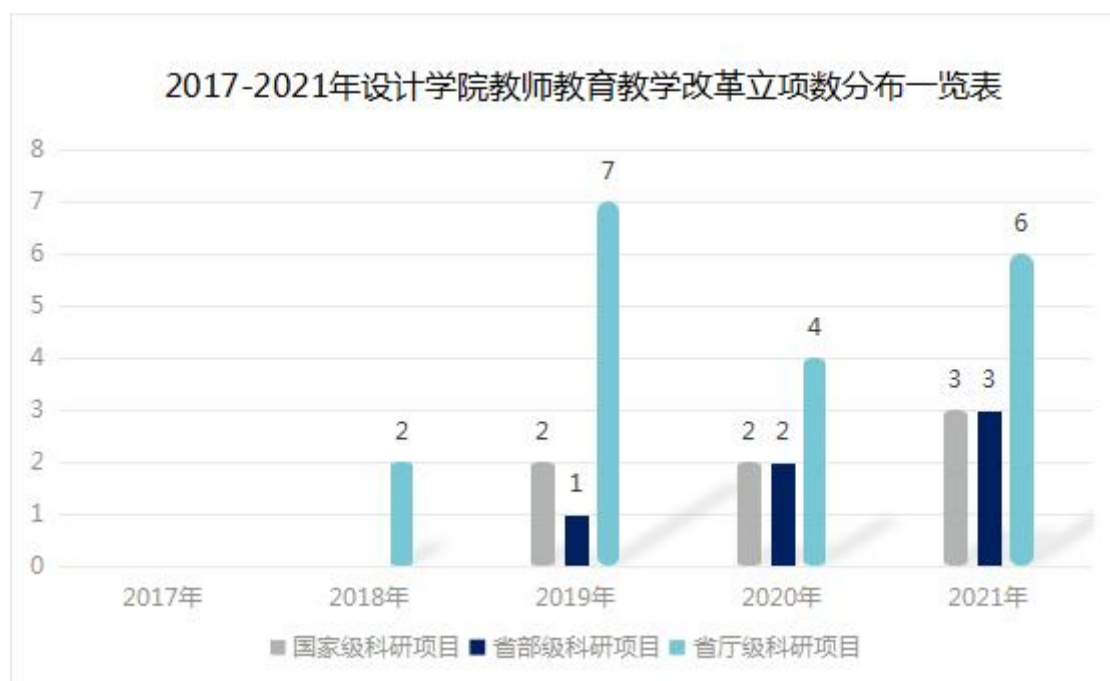
图 4 2017-2021 年设计学院教师教育教学改革立项数分布一览表