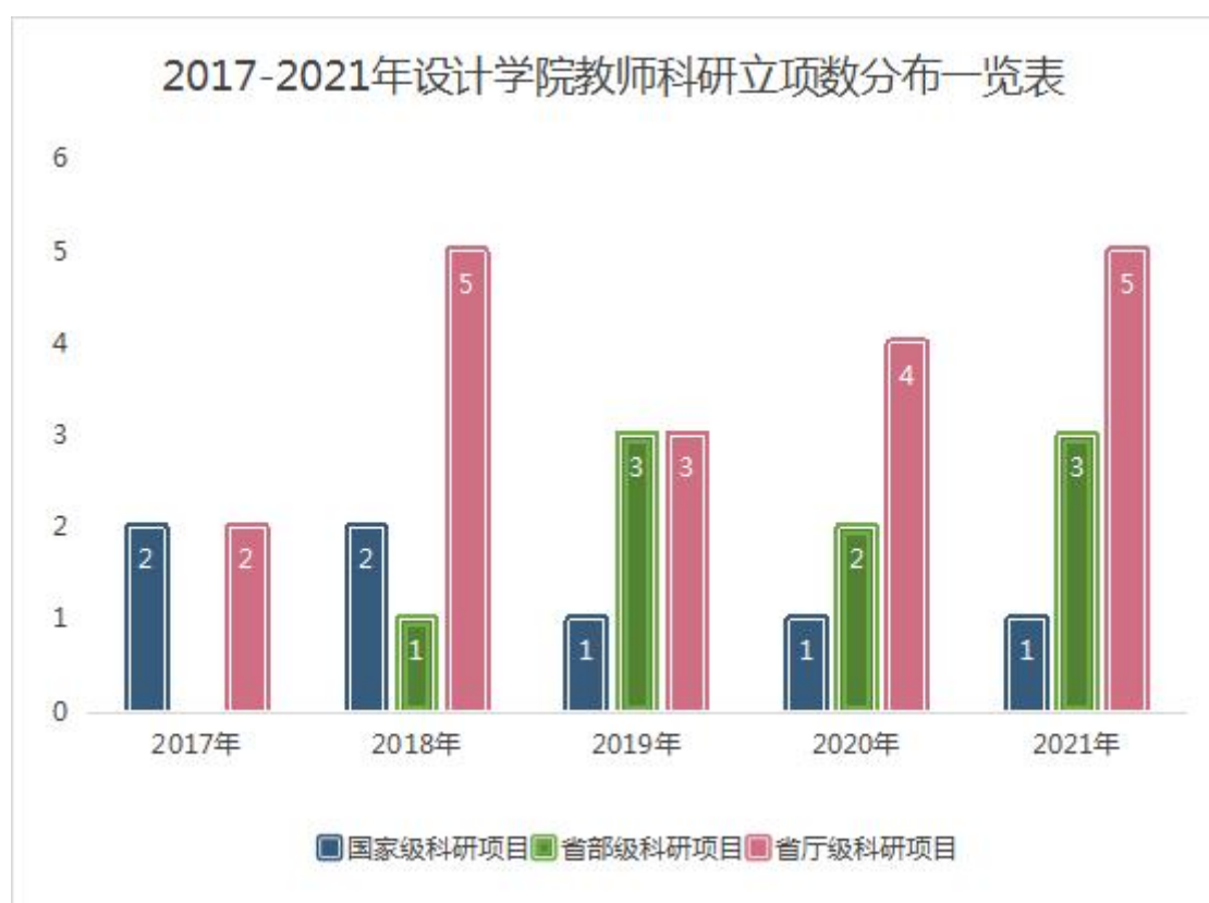
图 5 2017-2021 年设计学院教师科研立项数分布一览表